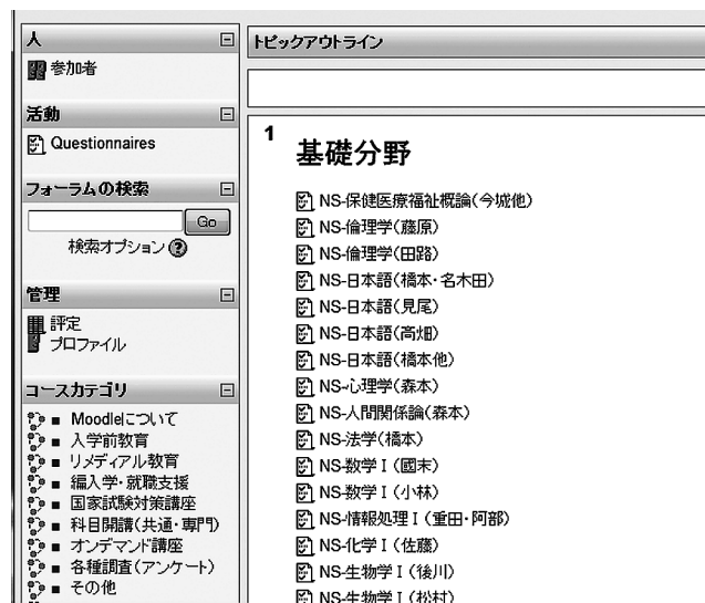
図2 初年次教育授業評価アンケートトップページ

アンケートは指定した期間 (5月中旬から6月下旬) に情報教育室のパソコンを利用して、学科ごとに実施者指導のもと、学生に一斉回答させる方法で実施した。平成21年度は先行実施した看護科を除く初年次学生231名に対し実施し、回答者数は222名、回答率は96%であった。全学科同時期実施になった平成22年度は初年次学生347名に対し回答者数は339名、回答率は98%、